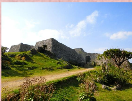
稀代の英雄、護佐丸の城 中城グスク