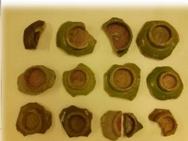
中城グスク出土中国産青磁