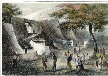
『日本遠征記』中城城跡及び近辺の挿絵

令和 2 年度に中城村にて行われた『中城城跡展』と今年 5 月に行われた『もう一つのグスク 新垣グスク』をおきみゅーにてリバイバル展示を行います。中城グスクと新垣グスクにおける最新の発掘調査から新たに分かった事実を紹介すると共に、当館が所蔵する中城グスクに関連する資料をあわせて公開いたします。