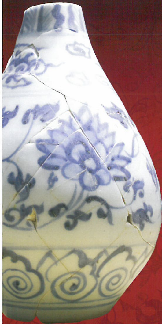
せいかにびん 中国産青花瓶