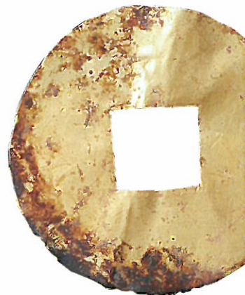
あかたうじょう うたき 「赤田御門の御嶽」 えんしょうせん 出土の厭勝銭